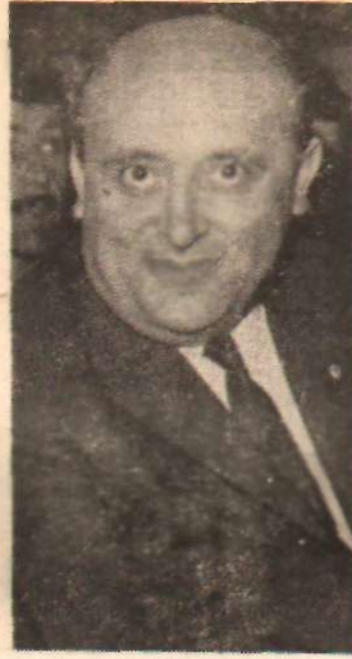
A.P. Başkanı Demirel Erzetil...

1965 seçimlerinde artık 1961 de olduğu gibi, «Gözlerimin içine bakın» edebiyatıyla kolaydan başarı sağlamak mümkün görünmemektedir. AP, II Genel Meclis seçimlerinde aldığı yüzde 50'ye yakın oyu, tüccarlık politikasıyla almıştı. Herhalde büyük güçlük çekecek, büyük bir ihtimalla gerileyecektir. Tüccardan yana olup, halkı da peşinden sürükleyebilme devri, Türkiye'de yavaş yavaş kapanmak üzeredir. Bunun içindir ki, AP, in hitat yoluna girmiştir. Karadeniz gezisi, bu inhitatın çarpıcı örneklerinden biridir. Ne var ki AP, nin tüccar-sever yöneticileri, bunun farkında değillerdir. Önüne geleni komünistlikle suçlayarak halkı uyutabilecekleri inancındadırlar. AP Genel Başkanı, «CHP, yi solculukla mücadele etmediği için devirdik» diyecek kadar ölücü kaçırmıştır. Bölükbaşı ise, müzayedeyi artırarak, bu sefer «AP'nin solcularla mücadele etmediğini» ileri sürmüştür. Böyle bir solculukla mücadele müzayedesi, meselenin ne kadar komplikleştirildiğini göstermektedir. Bakanların aşırı cereyanlarla mücadele komitesi çalışmaları da bulvarlarda dergi satışı ölemek için Belediye Zabıta Kanununu uygulat-