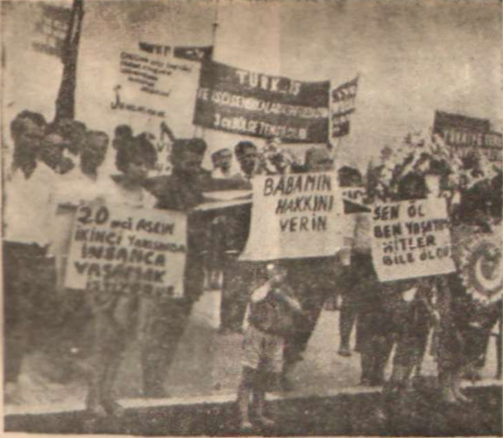
İzmirde işçilerin gösterisi Çıplak ayaklar...

en büyük kundura fabrikası olan Safak Kundura'da işveren toplu sözleşme masasında sendikamın zam taleplerini devamlı şekilde reddetti. Sendika haklı birçok maddeyi feragat ettiği halde işveren zam işine yanaşmıyordu. İş uzlaşma kuruluna gitti. Kurul %15 zam kabul ettiği halde işveren buna da yanaşmadı. Bunun üzerine sendika uzlaşma kurulunun kabul ettiği miktardan daha aşağı inip saat ücretlerine on kuruş zam istedi. Lâkin işveren nuh diyor, peygamber demiyordu. İşverenin kabul etmemesi üzerine işçiler greve gittiler.