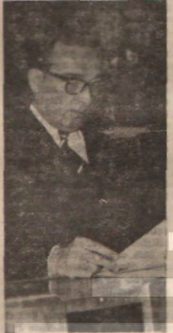
Turhan Feyzioğlu «Kendimize güvenelim»

Yabancı Sermaye Kanununa göre gelen sermayenin büyük çoğunluğu montaj sanayiine gitmektedir. Montaj sanayi ise, bir cins ithalat inhisarından başka bir şey değildir. İKA ajansı, Türkiye'de montaj sanayiinin durumu ile ilgili bazı bilgiler yayınlamıştır. Bu bilgilere göre, montaj sanayi, kamyon ve kamyonet, ta-